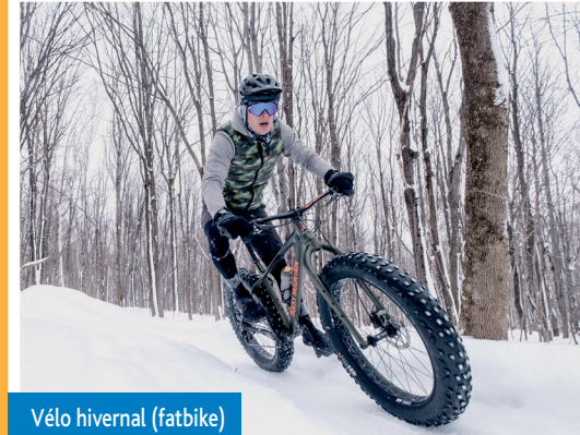
Vélo hivernal (fatbike)

Les Sentiers La Balade de Lévis Club de golf Beurivage Parcours des Anses Parc Valero les Écarts