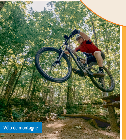
Vélo de montagne